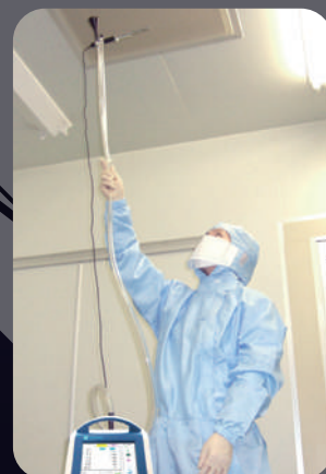
当社クリモマスター風速計用 プローブを使った環境計測風景