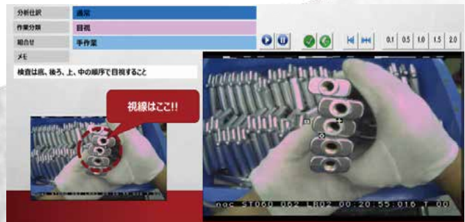
メッキ加工の目視検査：動画教育マニュアル