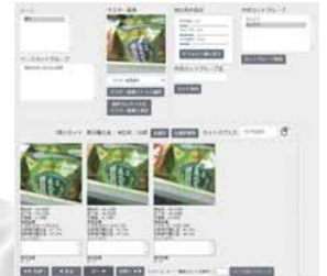
技能伝承：画像マッチング