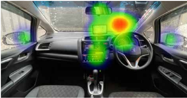
運転時：ヒートマップ解析 (注視していた場所)

注視時間や瞳孔径を基準に閾値を設けて解析、画像マッチング機能で「関心」があったものを自動で抽出、AOI 分析機能などができるようになりました。