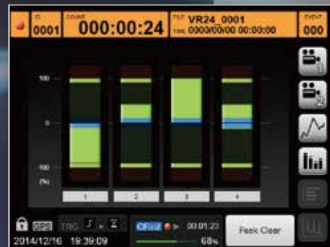
データレベルをバーメーターで表示