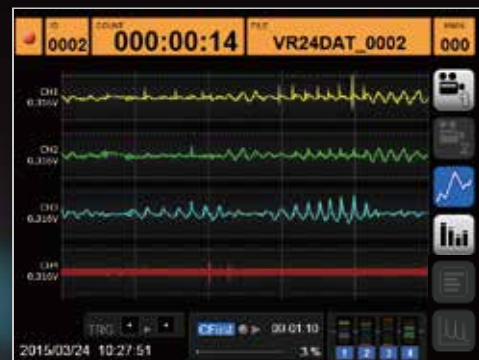
データレベルを波形で表示