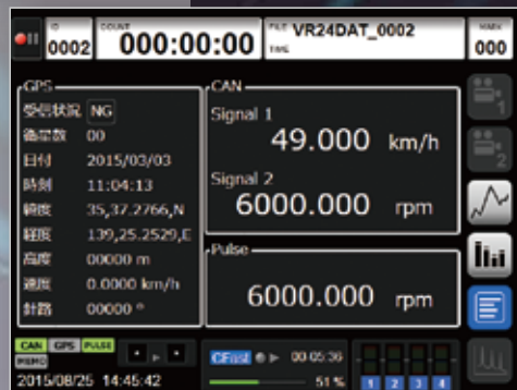
CAN・GPS・パルス表示画面