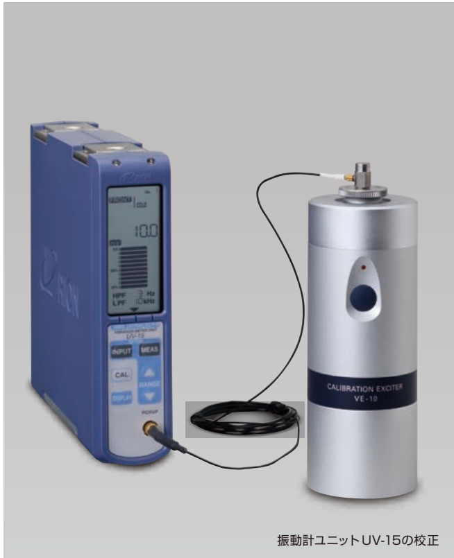
振動計ユニットUV-15の校正

VE-10はハンディタイプの加振器で、圧電式加速度ピックアップおよび、それを用いた振動計や振動計測システムを校正するための、単一周波数の基準振動源（正弦波）です。直径5 cm、長さ13 cm、重さ600 gと、小型軽量のため持ち運びが容易です。また、乾電池動作のため現場で使用することができます。